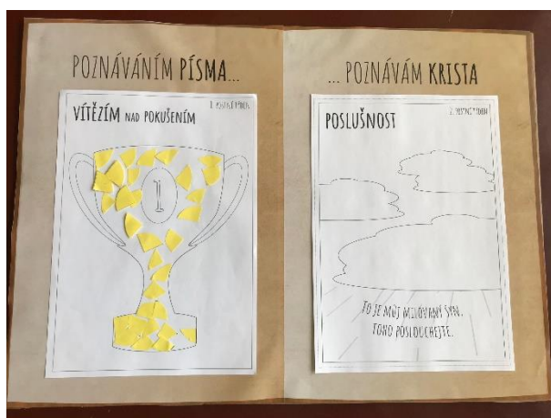
Plakát kniha - Bible

Materiál ke stažení naleznete zde: https://www.katechetiolomouc.cz/news/postni-aktivita-2020-poznavanim-pisma-poznavam-krista/